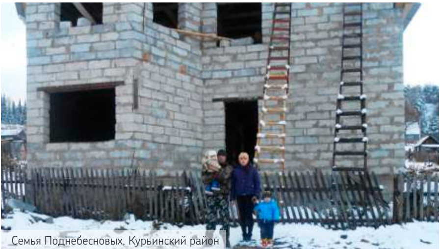
Семья Поднебесных, Курьинский район