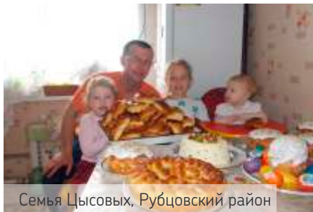
Семья Цысовых, Рубцовский район