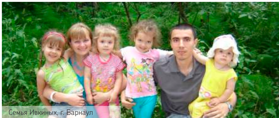
Семья Ивкиных, г. Барнаул