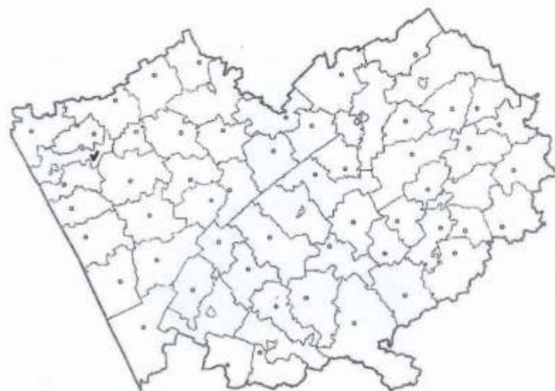
Картосхема Алтайского края