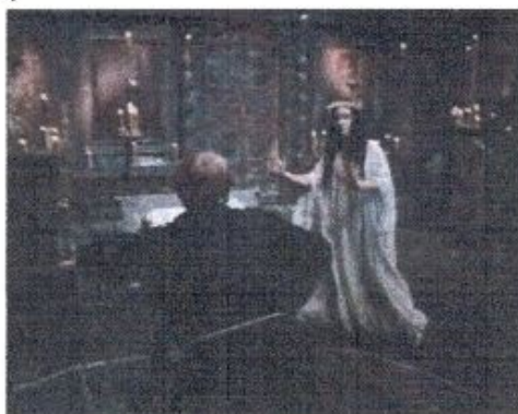
«Вий» И.В. Голицы.