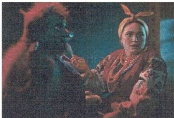
«Волк на хвосте, или Бременские музыканты»