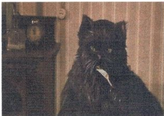
«Мастер и Маргарита» М.А. Булгаков